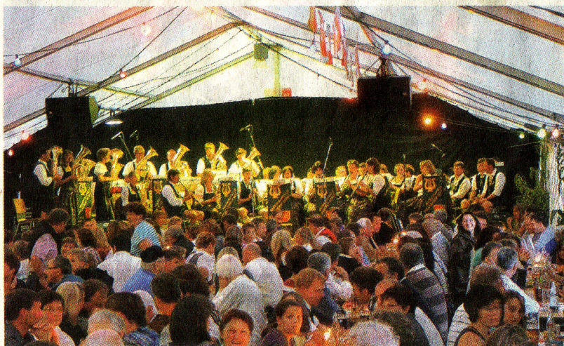
Kaum ein freier Platz war mehr zu finden, als die Musikkapelle Pflugdorf-Stadl im Zelt spielte.